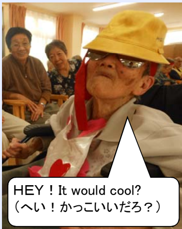
HEY! It would cool? (へい! かっこいいだろ?)